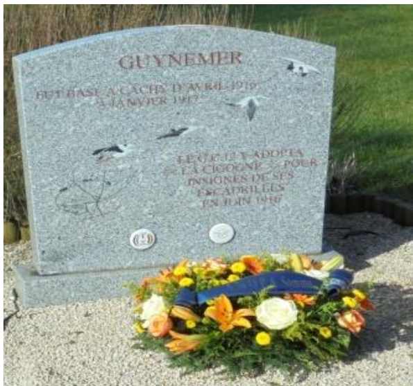
La stèle de G. Guynemer