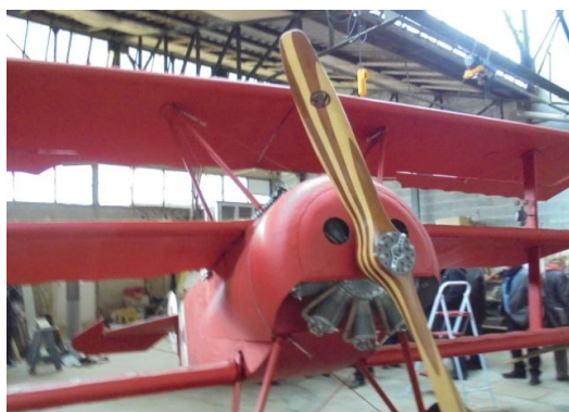
Fidèle réplique du Fokker DRI de Richthofen

Organisation : Mireille Hollville Co-organisatrice : Colette Boitel Numérisation : Joëlle Duchaussoy - Serge Maquet