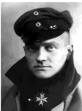
Manfred von Richthofen